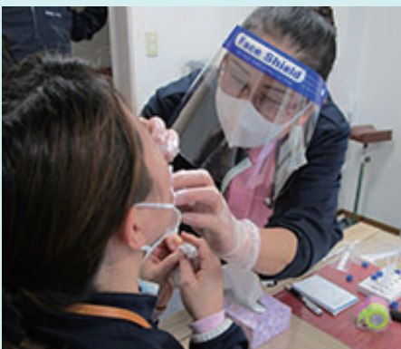
定期的な検査を実施。