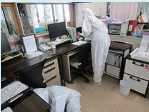
施設内の消毒も実施。