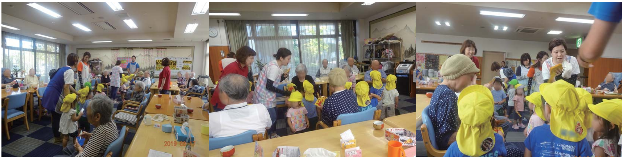
ご利用者の皆様に近所の保育園児の皆様から手形で作成した、お祝いをいただきました。 かわいい「てがた」ありがとうございました。