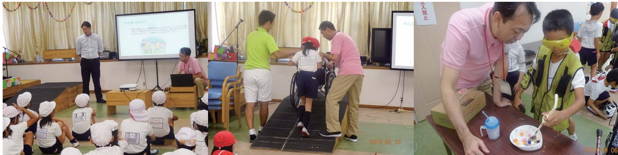
小学生の総合学習で「お年寄りについて」学びました

〒861-4134 熊本市南区刈草3丁目3-15 TEL.096-277-7300 FAX.096-277-7775 ホームページ http://www.seiwa-kaigo.com/