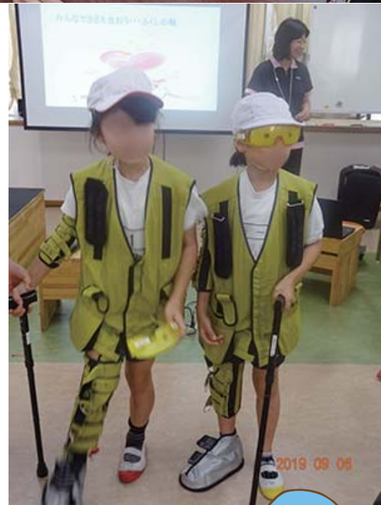
真剣に模擬体験も実施。 先生にも大変お世話になりました。車椅子の体験いかがだったでしょうか。