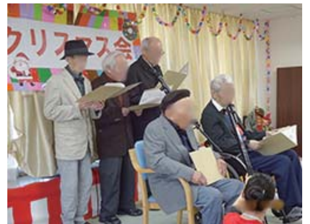
クリスマス会を開催しました。